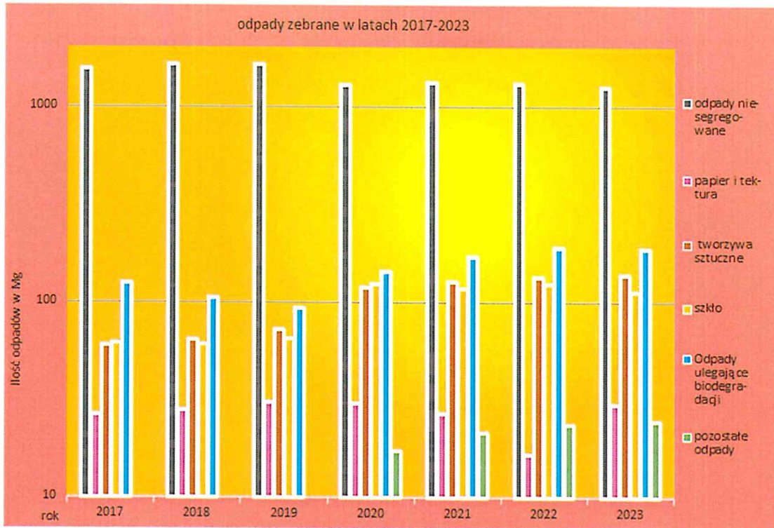
Wykres. Odpady komunalne na przełomie lat 2017-2023