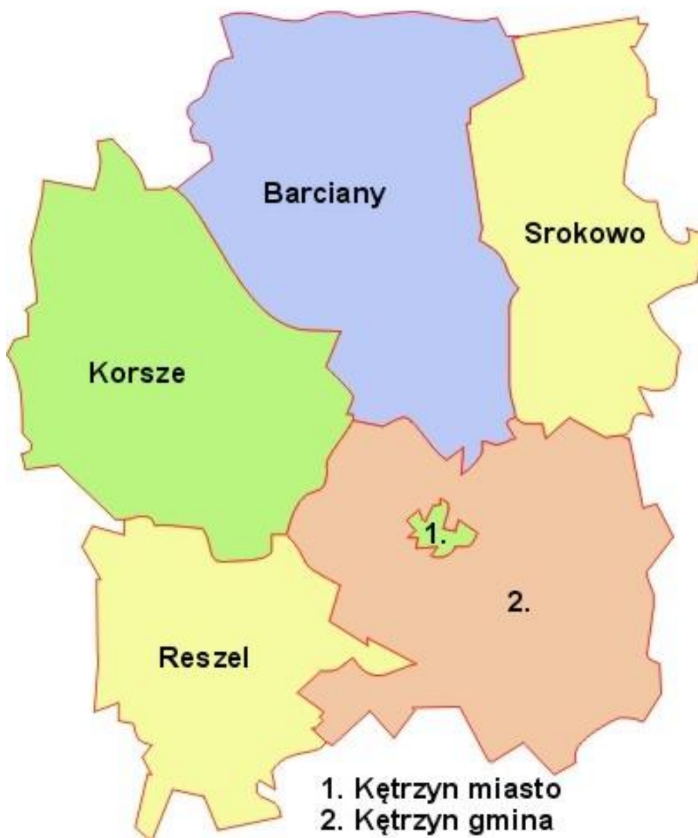
Położenie Gminy Reszel na tle powiatu kętrzyńskiego

Obszar Gminy położony jest na obszarze Pojezierza Mrągowskiego. Mezoregion ten wchodzi w skład makroregionu Pojezierza Mazurskiego. Wraz z Pojezierzami Południowobałtyckimi jest on częścią około bałtyckiej strefy pojeziernej. Jest to teren o charakterze falistym, lokalnie pagórkowatym i nachylony jest w kierunku północno - zachodnim. Obszar objęty najbardziej zróżnicowaną rzeźbą to południowa część Gminy, gdzie występują wysokości rzędu 180-200 m n.p.m., a spadki na zboczach wynoszą kilkanaście procent, miejscami nawet ponad 20 %. Największe wyniesienia