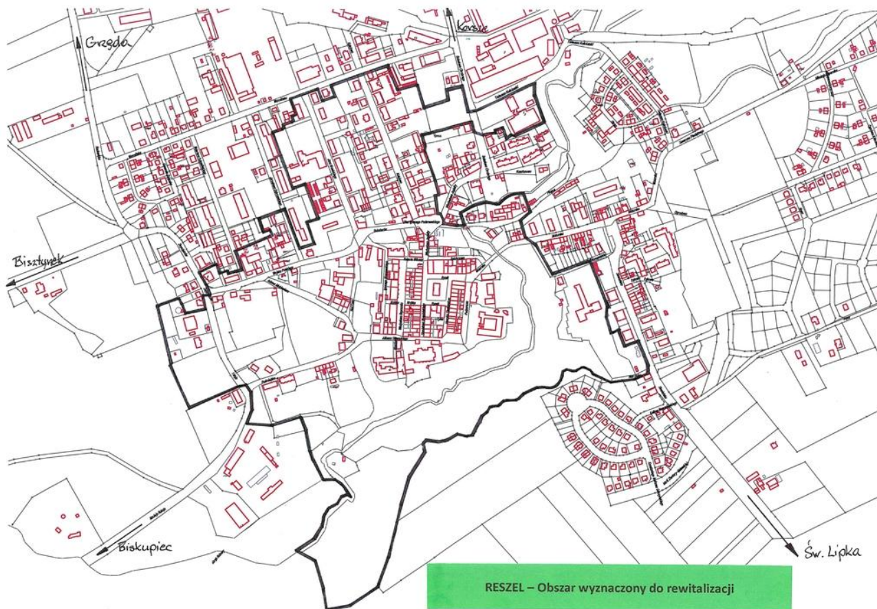
Rysunek 17. Obszar rewitalizacji na terenie Gminy Reszel.

Brak działań na tym terenie nie tylko pogłębi stan kryzysowy, ale również może negatywnie oddziaływać na inne części gminy szczególnie w sferze społecznej, ale także w zakresie rozwoju lokalnej gospodarki.